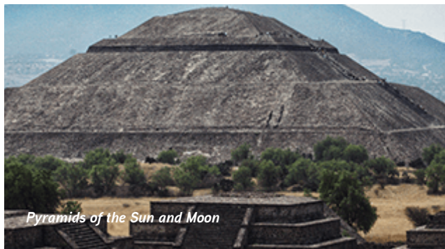
Pyramids of the Sun and Moon