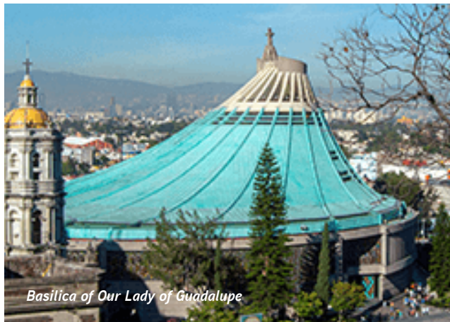
Basilica of Our Lady of Guadalupe

Nakon sv. mise u Metropolitanskoj katedrali, uživat ćemo u obilasku znamenitosti Mexico Cityja, uključujući Kuću pločica i aveniju Reforma. Prošetat ćemo oko Zocala, Palacio Nacional i Velikog hrama (posjet zvana). Osim toga, posjetit ćemo relikvije bl. Miguela Proa u crkvi Svete Obitelji prije povratka u svetište Gospe od Guadalupe na popodnevnu molitvu. Dan ćemo završiti uz oproštajnu večeru. (doručak, večera)