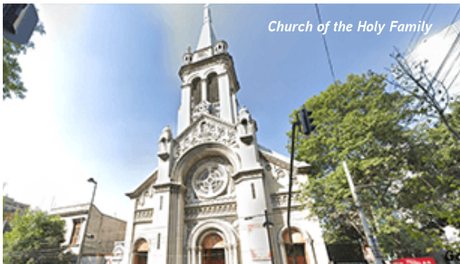
Church of the Holy Family